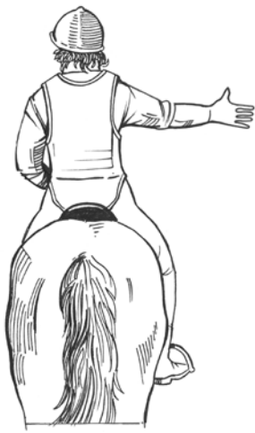
Jeg vil svinge til høyre